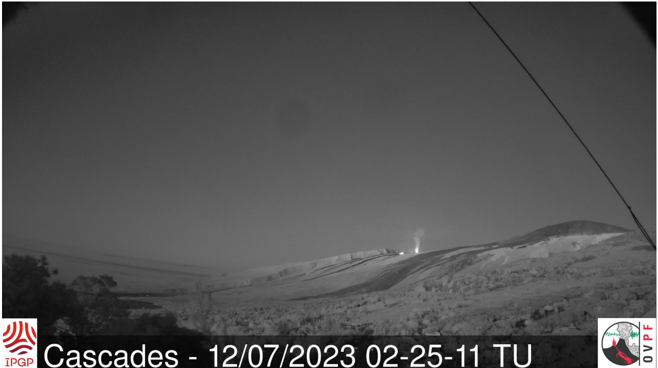
Figure 3 : Prise de vue des coulées de lave actives en haut des Grand Pentès le 12/07/2023 à 06h25 heure locale (02h25UTC) depuis la webcam de l'OVFP située à Piton des Cascades.

A l'heure actuelle aucune déformation significative de l'édifice n'est enregistrée.