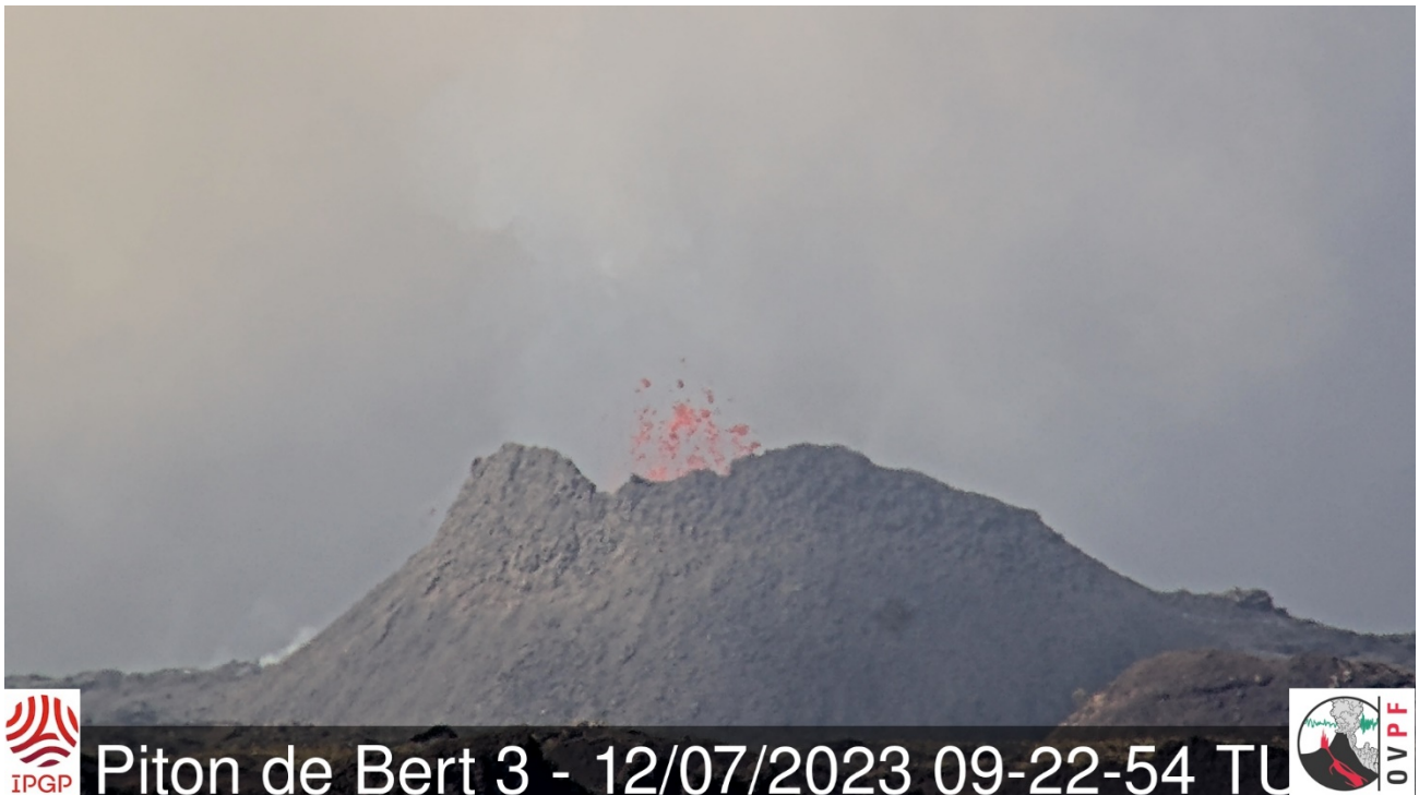
Figure 2 : Prise de vue du point d'émission actif situé au sud-est de l'Enclos Fouqué à 13h22 heure locale (09h22 UTC) le 12/07/2023. Image zoomée depuis la webcam IRT-OVPF-IPGP située au Piton de Bert.

Le cône volcanique actif - situé au sud-est de l'Enclos Fouqué à 1720 m d'altitude - poursuit son édification par accumulation des projections de lave (Figure 2).