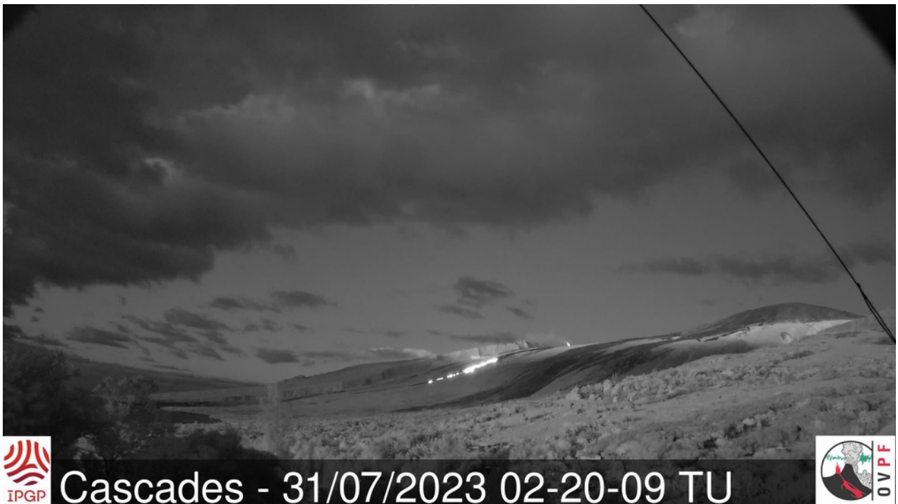
Figure 3 : Prise de vue des coulées de lave actives en haut des Grand Pentes le 31/07/2023 à 06h20 heure locale (02h20 UTC) depuis la webcam de l'OVPF-IPGP située à Piton des Cascades.